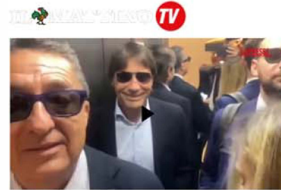
Conte nuovo allenatore Napoli: «È un grande giorno»

Mercoledì 29 Maggio 2024, 10:22 - Ultimo agg. 2 Giugno, 15:39 2 Minuti di Lettura